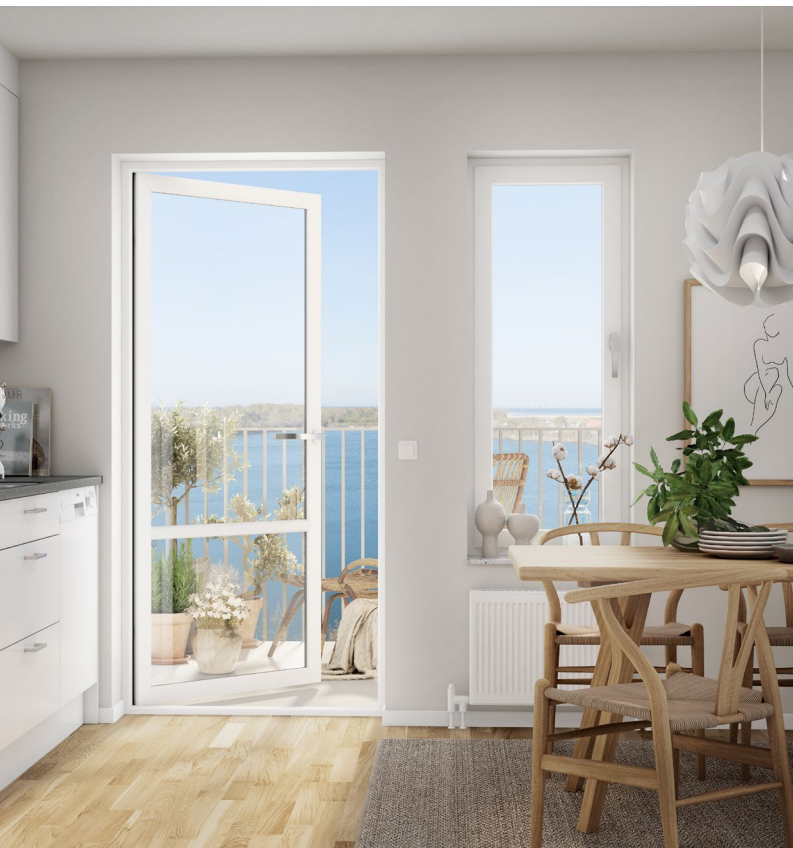
I ett naturnära läge i Klagshamn är det snart byggstart för HSB brf Vattenbrynet.