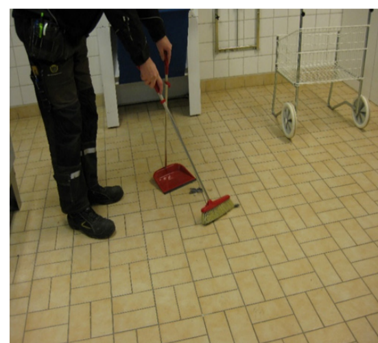
4 Sopa och torka golvet. / Sweep and dry the floor.