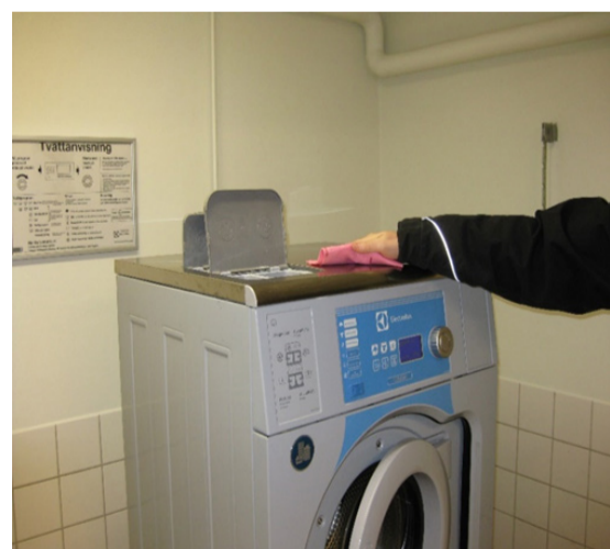
1 Torka av maskinerna. / Wipe off the machines.