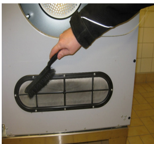
2 Ta bort ludd från torktumlaren. / Remove lint from dryer.