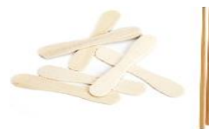
Glasspinnar och matpinnar