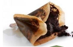
Kaffesump & filter