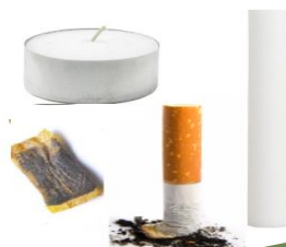
Cigarettfimpar, snus stearinljus