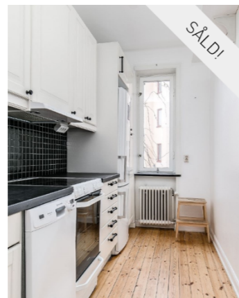
Alströmergatan 32L, 1 rok, 28 kvm SLUTPRIS 2 750 000 kr