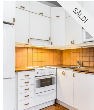
Alströmergatan 32S, 1 rok, 30 kvm SLUTPRIS 2 600 000 kr

Vill du börja det nya året med en ny bostad? Kika då gärna in på vår Instagram (svenskfast_kungsholmen) för tips på nya lägenheter!