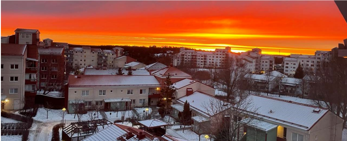
Soluppgång över Diligensvägen i februari 2023

Här kommer en kortfattad resumé över vad som hänt i föreningen under 2023. Alla delar/projekt finns inte med, men i grova drag finns beskrivet några av de projekt som genomförts.