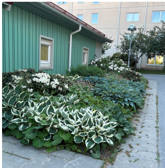
Plantering gård 12 i juni 2023

28-29 oktober så fanns möjlighet att rensa i sina förråd och tömma i föreningens egna container som stod uppställd på vändplanen Landåvägen mellan kl. 9-15.