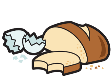
Bröd, äggskal, pasta, ris