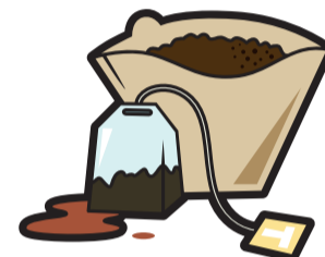
Teblad, tepåsar, kaffesump, filter, ofärgat hushållspapper