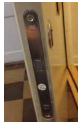
Förberedd plats för extra lås (dörren på bilden har ett lås monterat)

*) Klass 2: Motstår angrepp med enkla verktyg, provtid 3 min inom totalt 15 min. Tryck mot lås respektive mot hörn är 6 kN respektive 1,5 kN. Avvärjer inbrottsförsök med små, enklare handverktyg.