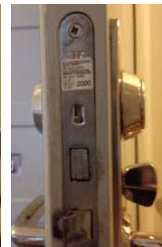
Omställare i nedfällt läge