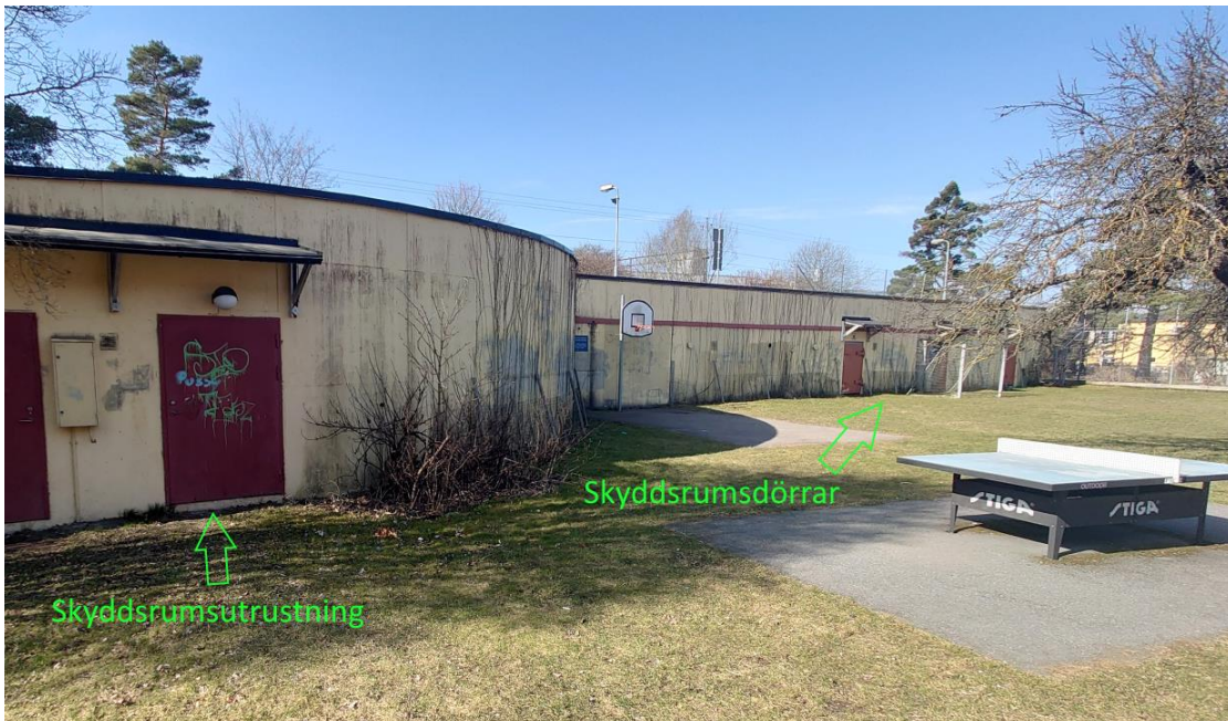
Figur 3 - Översiktsbild utifrån