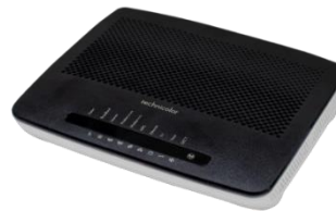
Äldre router, Technicolor