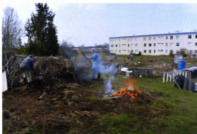
Vårstädning hos Tibbleängens Trädgårdsförening. Läs mer om denna på s.2.