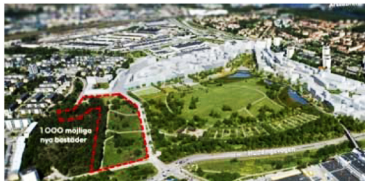
Årstafältet södra, Årsta.

Är det här något som kan gynna vår förening med tanke på service och kommunikationer? Ytterligare information hittar du på: