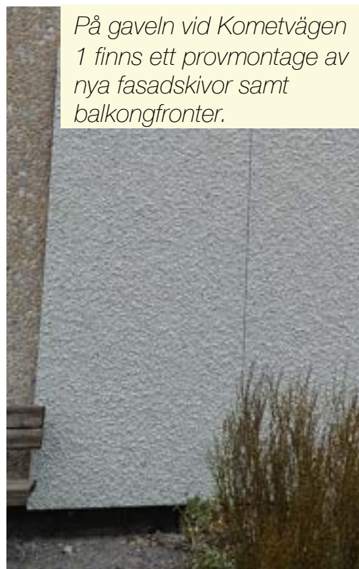
På gaveln vid Kometvägen 1 finns ett provmontage av nya fasadskivor samt balkongfronter.