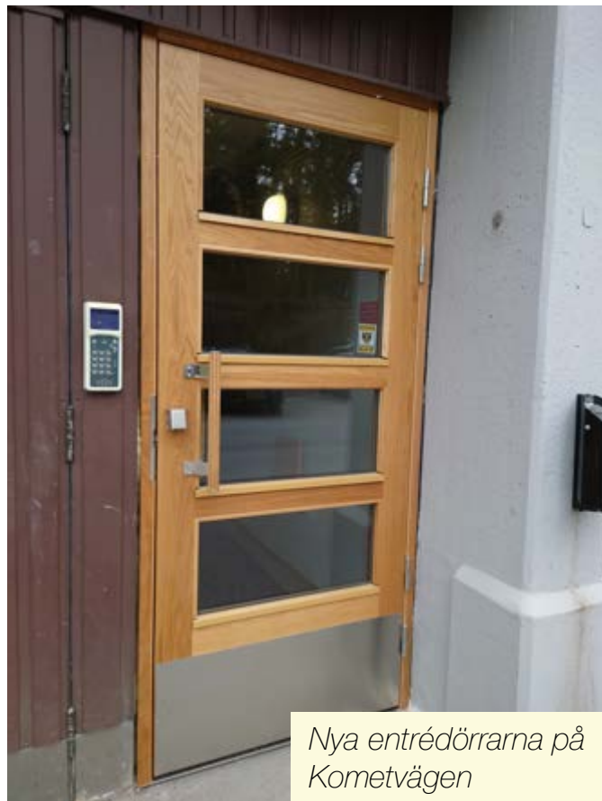
Nya entrédörrarna på Kometvägen

Entreprenörerna kommer att ta största möjliga hänsyn till boende och ber om förståelse att arbetet stundtals kan medföra störningar.