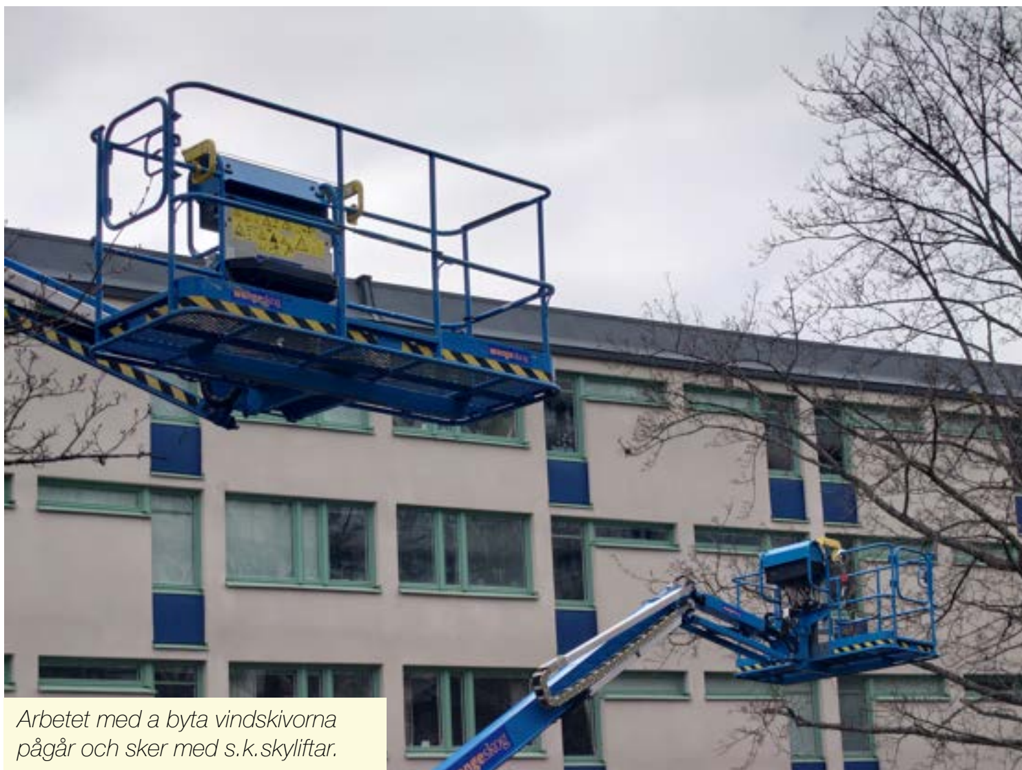
Arbetet med att byta vindskivorna pågår och sker med s.k. skyliftar.