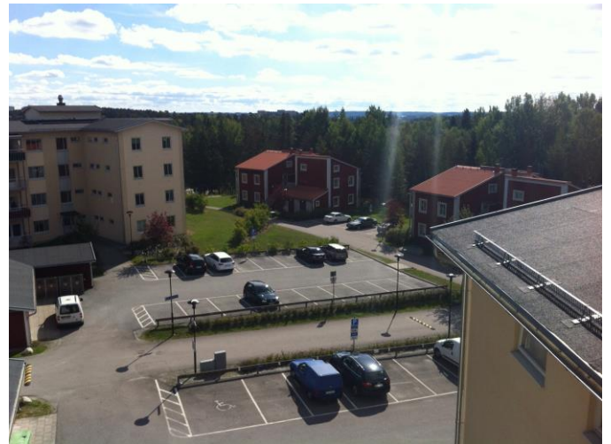
Utsikten från taket