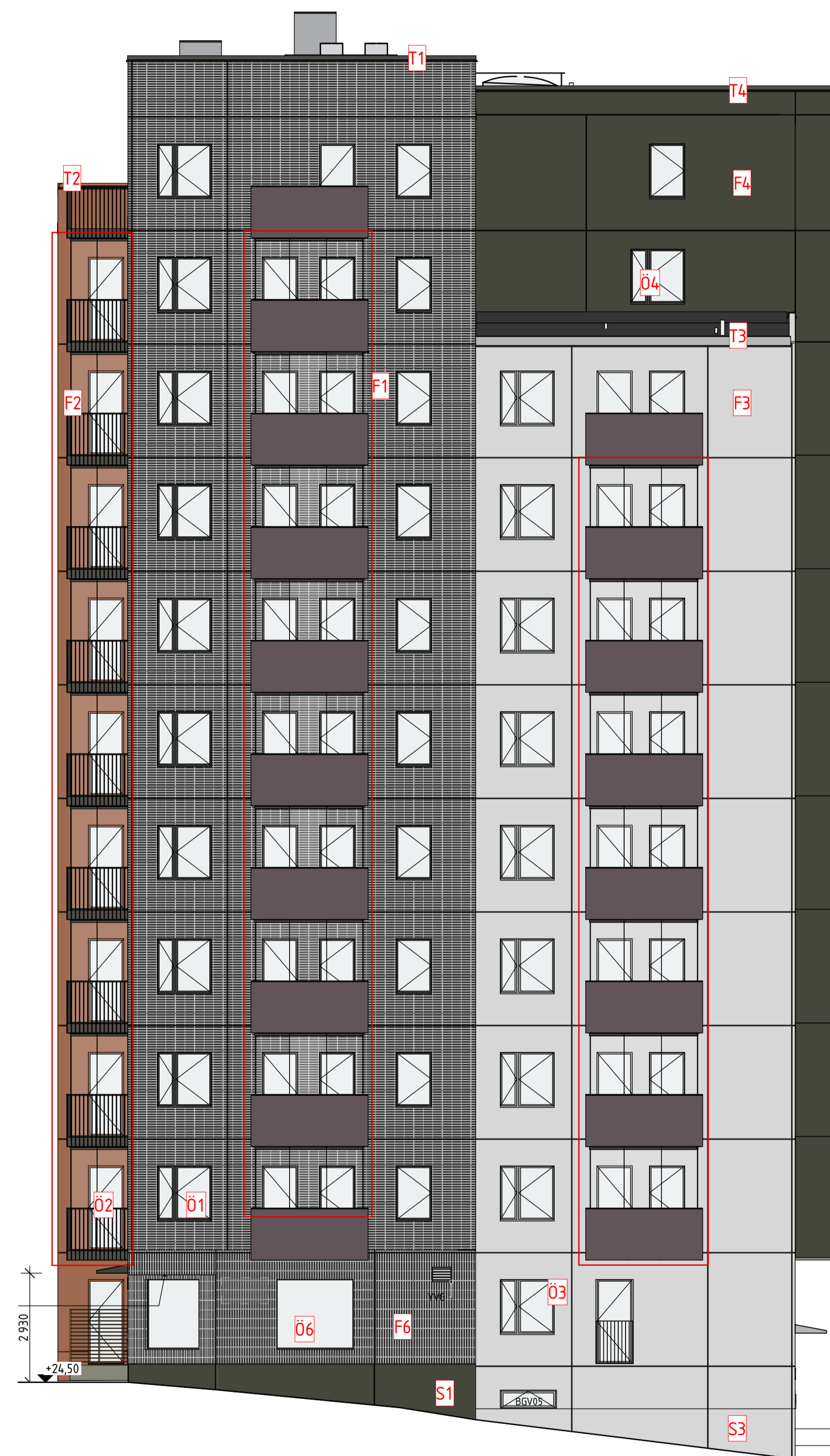
F02 FASAD MOT SO