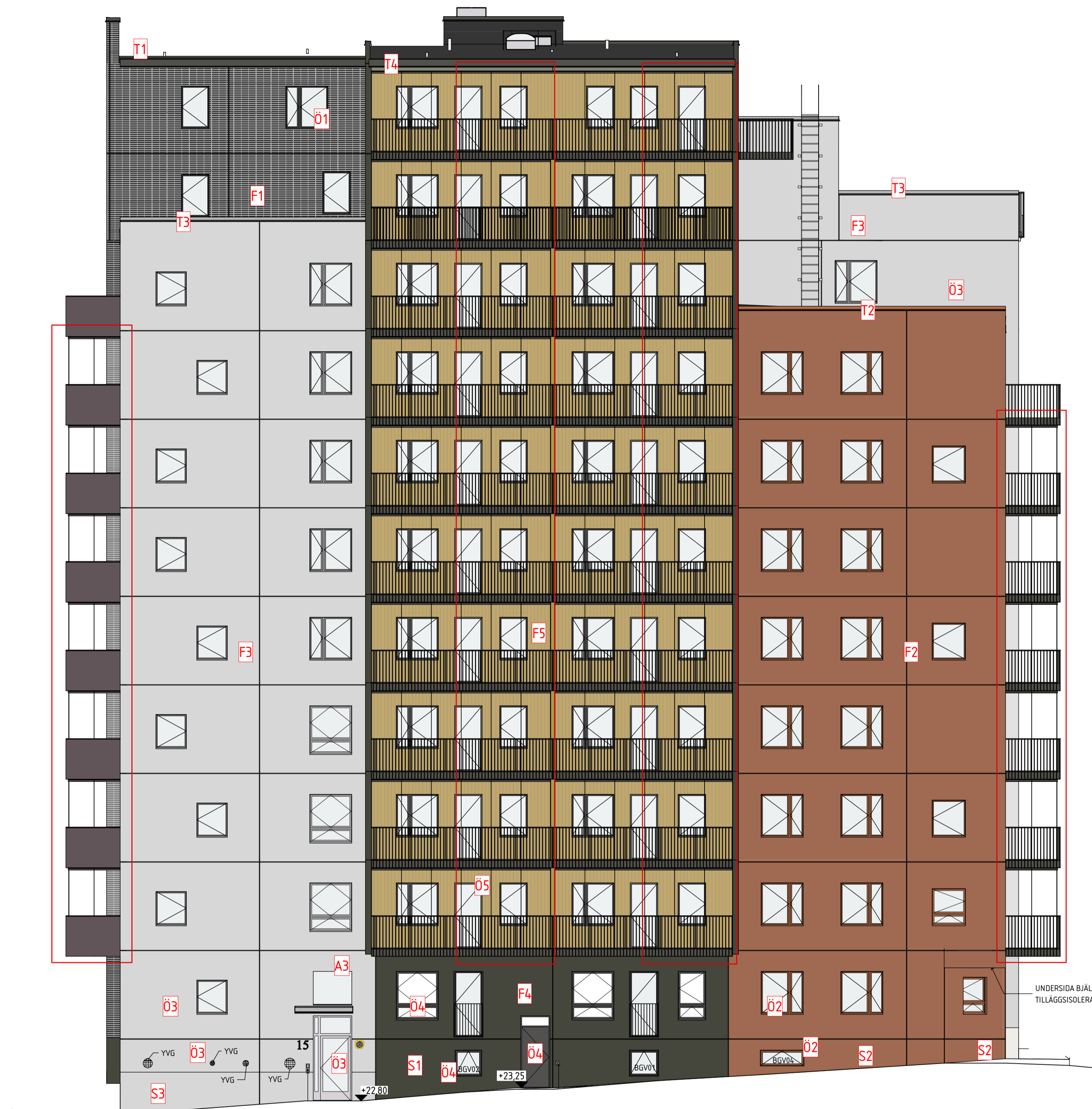
F01 FASAD MOT NO