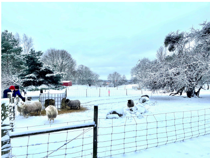
Vännerna i fårhagen.