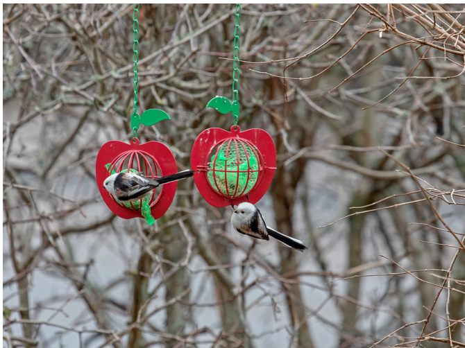
Gemensam måltid.