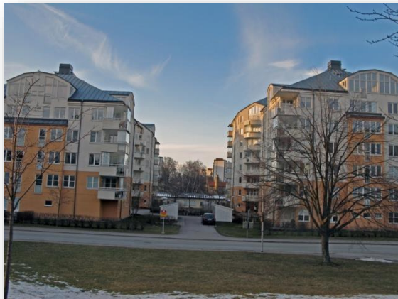
De fyra husen ses i nordlig riktning från uppfarten till Jakobsbergs sjukhus.

Områden med naturskydd är Järvafältet i öster samt Görvälns naturreservat i väster där Mälaren tar vid.