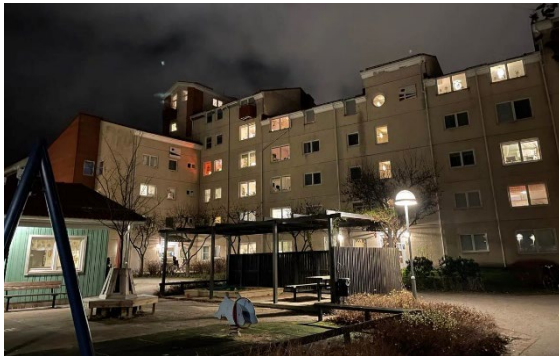
Gård 13 - en sen höstkväll i november

Renovering/utbyte av vårt avloppssystem finns i vår underhållsplan. Landåvägen L4-L8 på Gård 13 har redan behov av utbyte av vissa delar. Vi har därför tidigare lagt renovering av denna del, med start årsskiftet 2022/2023. Utförlig avisering till de boende i dessa trapphus kommer inom kort.