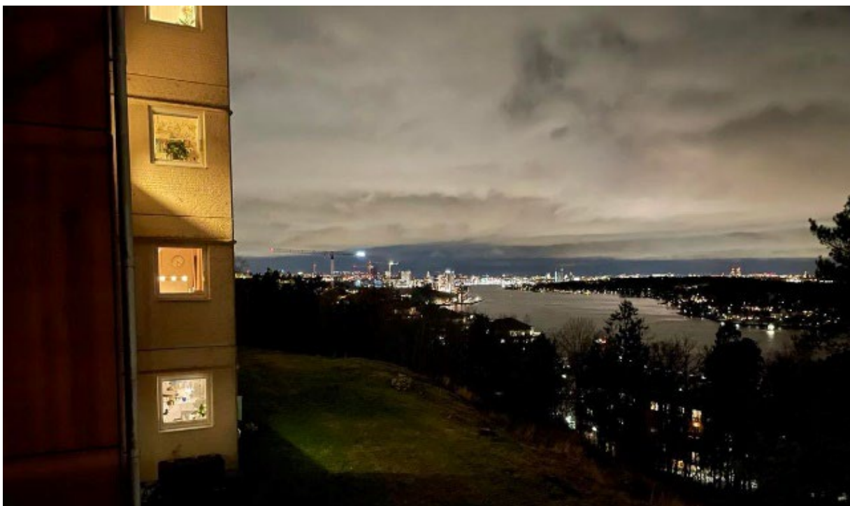
Utsikten från utkiksplatsen mellan fastigheterna inne på Gård 13S

Under året har Brf Mården deltagit i Samfällighetens arbete, bland annat för ett gemensamt projekt för etablering av laddstolpar för elbilar. Nu har Brf Mården ökat engagemanget ytterligare med representant som vice ordförande i samfälligheten. Vi ber att få återkomma vad gäller projekten som drivs i samfälligheten längre fram.