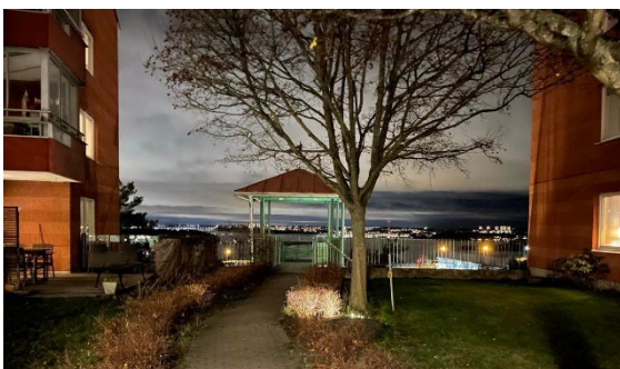
Utkiksplatsen på Gård 13

Brf Mården har två föreningslokaler: en på vardera gård (G12 och G13). Under året har båda lokalerna försetts med likvärdiga ljudanläggningar.