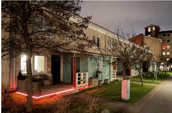
Många mysiga utomhusbelysningar finns i föreningen, här ett exempel på Gård 13.

oktober månad bytte Brf Mården därför driftpartner för systemet och i skrivande stund fortgår en genomlysning av systemen och målet är att allt (hård- och mjukvara) ska vara korrigerat till årsskiftet. Upplever du störningar, vänligen felanmäl till felanmalan@brfmarden.se .