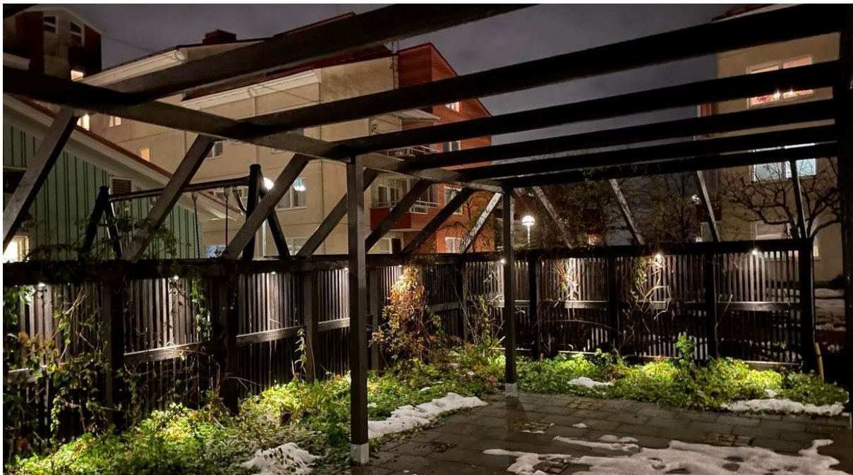
Grillplatsen på Gård 12

Föreningen har påbörjat en uppgradering av styr- och reglersystemet i våra fastigheter. Detta kommer att ge oss en bättre nyttjandegrad av fjärrvärmens och en bättre möjlighet till övervakning av värme och kyla. Valet av system /komponenter har gjorts efter erfarenheter från närliggande föreningar som har liknande installationer.