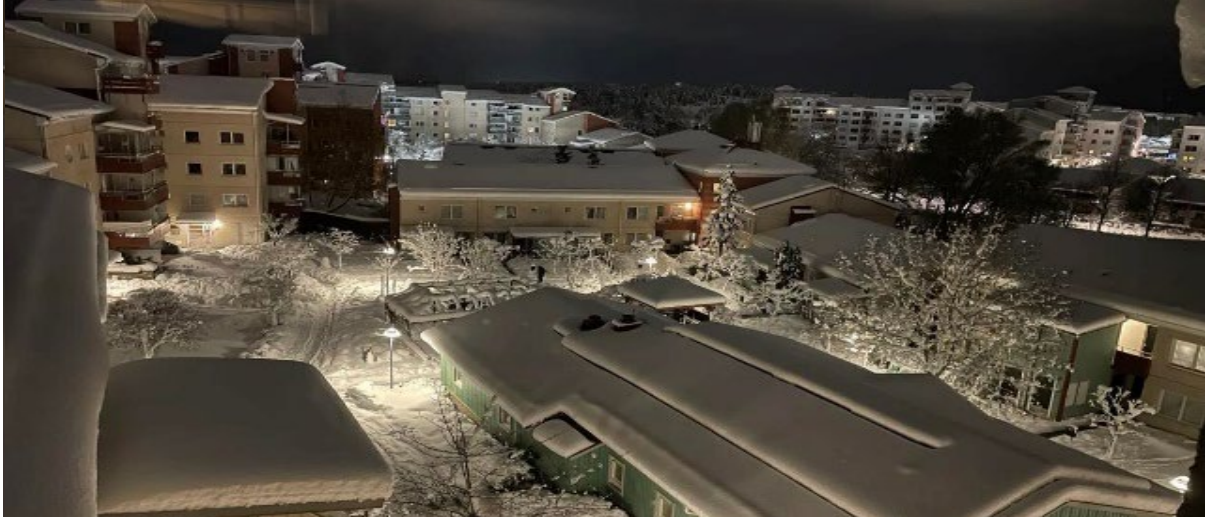
Gård 12 efter första snöfallet

Här kommer en kortfattad resumé över vad som hänt i föreningen under 2022. Alla delar/projekt finns inte med, men i grova drag finns beskrivet några av de projekt som genomförts.