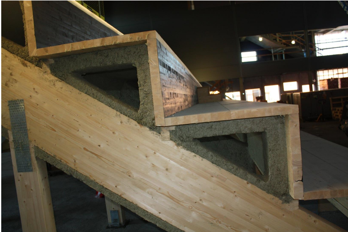
Brandisolering 60mm klass EI60